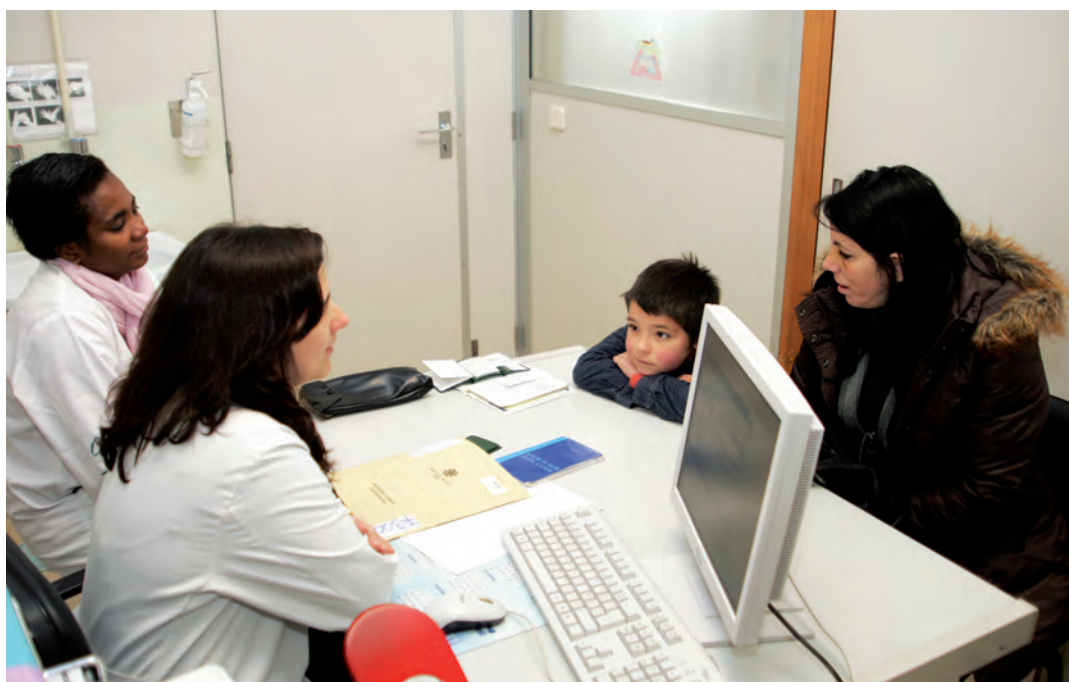
Os desafios da Unidade de Nefrologia Pediátrica a médio prazo serão consolidar a sua posição em termos formativos e científicos, e progredir no sentido da excelência e diferenciação da sua actividade assistencial, nomeadamente no que diz respeito às técnicas de tratamento substitutivo renal

Em Outubro de 2009, a Unidade iniciou, pela primeira vez um Ciclo de Estudos Especiais, com duração de 18 meses, cuja missão é dar formação e competências específicas e diferenciadas a